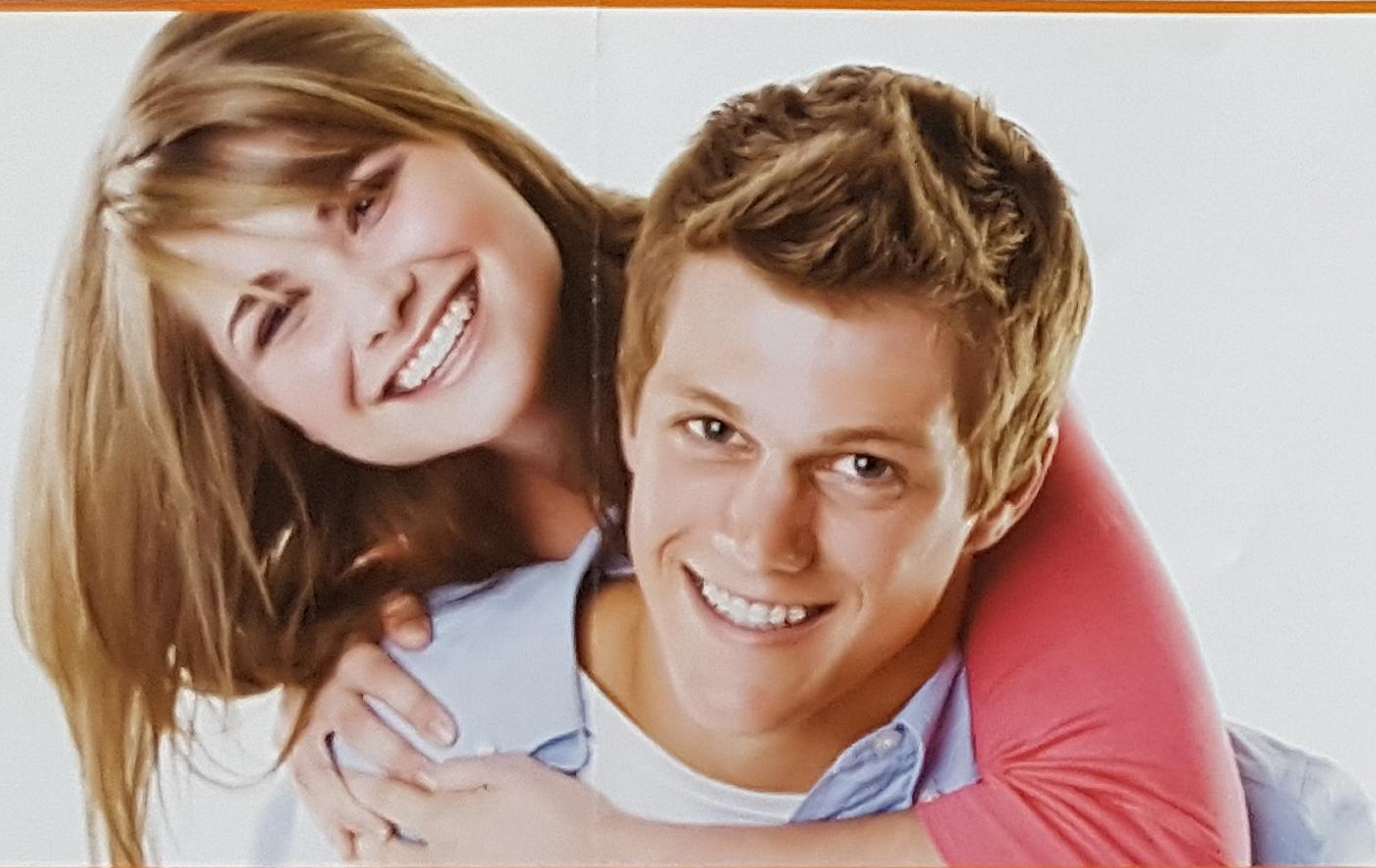
Damon Clear™ Bracket