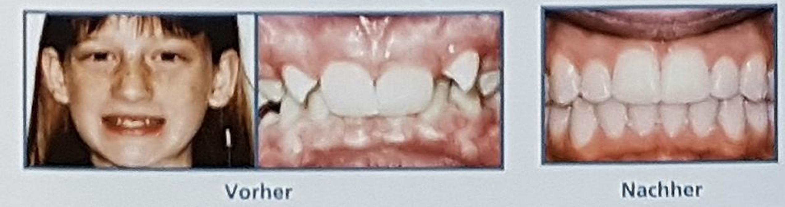
Behandlungsdauer: 16 Monate, 10 Termine

Das Damon System baut auf einer einzigartigen Behandlungsphilosophie auf, die über reine Zahnkorrekturen hinaus auf ein schönes, volles Lächeln abstellt. Dabei werden Gesicht, Profil und andere individuelle Faktoren auch unter dem Aspekt berücksichtigt, wie der Patient in 40, 50 oder mehr Jahren aussehen wird.