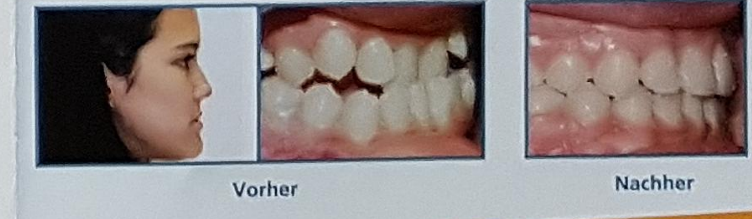
Behandlungsdauer: 20 Monate, 12 Termine

Die Zeiten, in denen Zahnspangen mit Ligaturen "fest gezogen" werden mussten, sind vorbei. Das Damon System arbeitet mit ligaturenfreien Brackets, die weniger Druck auf die Zähne ausüben, so dass diese leichter in die korrekte Position bewegt werden können. Dieser innovative Behandlungsansatz sorgt für mehr Tragekomfort.